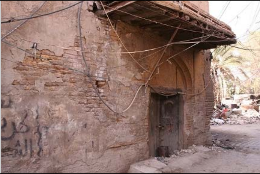
مديرية التحقيقات الجنائية/ بغداد، تفصيل في الواجهة الامامية.