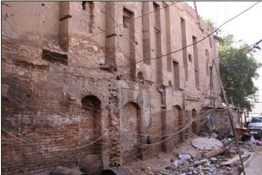
مديرية التحقيقات الجنائية/ بغداد، الواجهة الجانبية